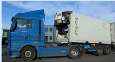
リーファーコンテナ