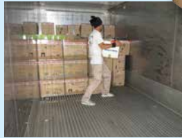
コンテナ内はアルミ張り