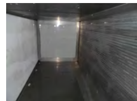
コンテナ内はアルミ張り