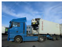
リーファーコンテナ